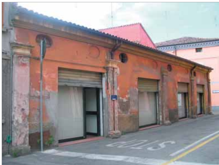
Via Farini 14 Fronte Principale